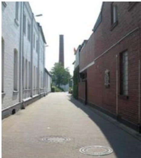
Zuwegung und Sichtbarkeit EMS-HALLE