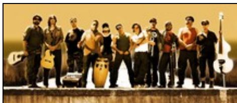
Los Dos Y Companeros

Und im Anschluss eine Brassband, die ihresgleichen sucht: Los Dos Y Companeros . Sie haben sich mit insgesamt elf Mitstreitern zum Ziel gesetzt, für die „gerechte Sache“ zu kämpfen und die heißt in diesem Falle „Salsa“. Eine durchaus ungewöhnliche, aber überaus gelungene Mischung aus kubanischen Rhythmen und