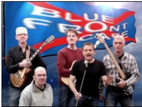
Blue Front Café

Zwei lokale Bands waren auf der Sparkassen-Jubiläumsbühne am Rathausplatz zu finden. Die Emsdettener Formation