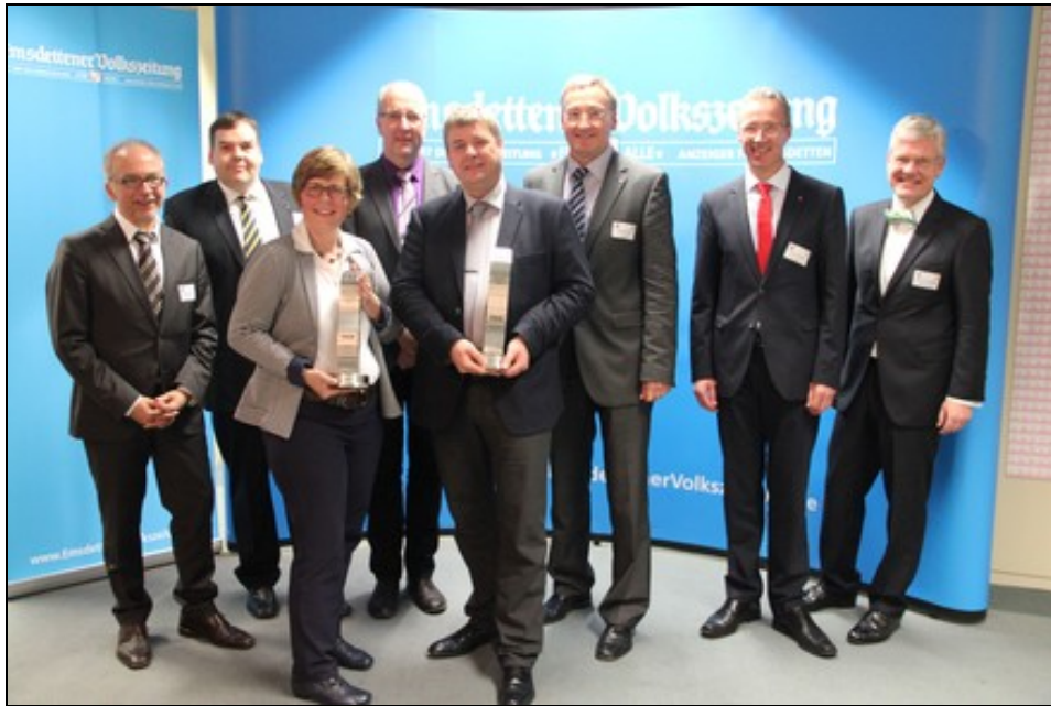
die Fischer Gruppe und Schuhhaus Hölscher erhalten den attraktiven Preis.