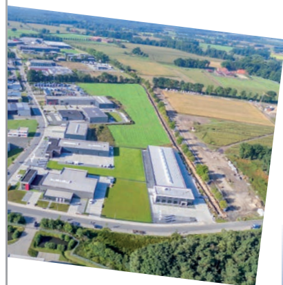
Die Erweiterungsflächen im Industriegebiet Süd-West

◀ gerundete Flächenreserven inkl. Reservierungen/Optionen (Stand 31.12.2018)