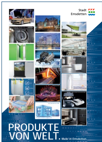
Plakat „Produkte von Welt“