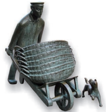
„Der Wannenschieber“ von Herbert Daubenspeck in der Innenstadt

Das Stadtzentrum von Emsdetten ist nicht nur Einzelhandels-, sondern auch Eventstandort, der immer wieder viele Bewohnerinnen und Bewohner des Umlands in die Emsstadt lockt. Nach der bis 2010 dauernden Innenstadt-Umgestaltung lädt der örtliche Einzelhandel mit vielen inhabergeführten Geschäften und einer vielfältigen Gastronomie zum Einkaufen und Verweilen ein. Im Rahmen des Innenstadtprozesses arbeiten alle innenstadtrelevanten Akteure eng zusammen, um die Innenstadt auch für die Zukunft attraktiv zu erhalten und zu gestalten. Hierbei entstehen u.a. neue Einkaufsangebote, bestehende Angebote werden serviceorientiert verbessert und das Erscheinungsbild der Innenstadt kontinuierlich optimiert.